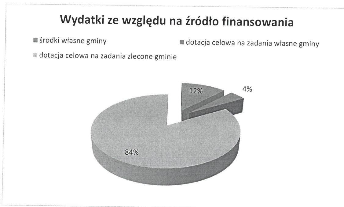
Wykres Nr 1. Wydatki GOPS ze względu na źródło finansowania.